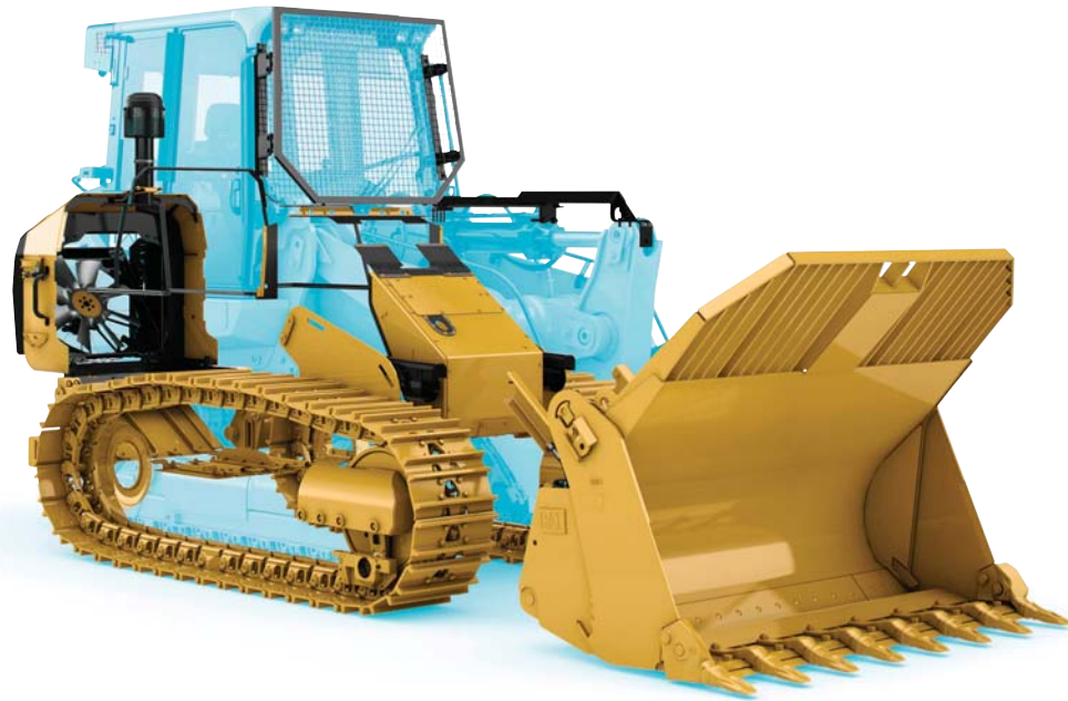
963K WH présentée.

Spécialement conçues pour des performances optimales